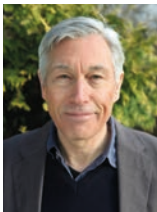
Veranstalter: Hans-Jürgen Berndt